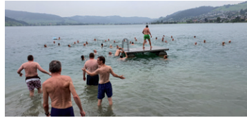
Nach der Taufe tauchten viele Teilnehmer gemäss dem Motto "eintauchen" vom Wochenende in den Ägerisee ein.

Männer mit ihrer See-Taufe vor der sichtbaren- und der unsichtbaren Welt, dass sie zu Jesus gehören! Was für ein Erlebnis!