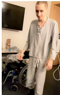
Seine ersten Schritte aus dem Rollstuhl.

Nach seiner Stabilisierung gelangt er in die Rehabilitationsklinik Bellikon, wo er wieder lernen sollte zu laufen.